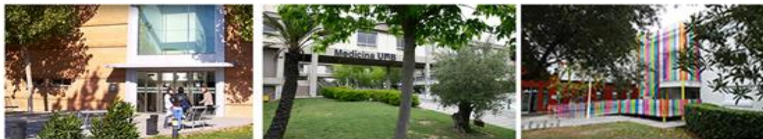
Campus Germans Trias i Pujol